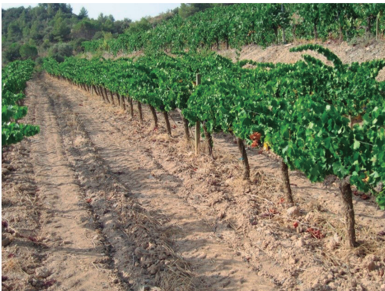
FIGURA 2. Terrasses de garnatxa. El Molar