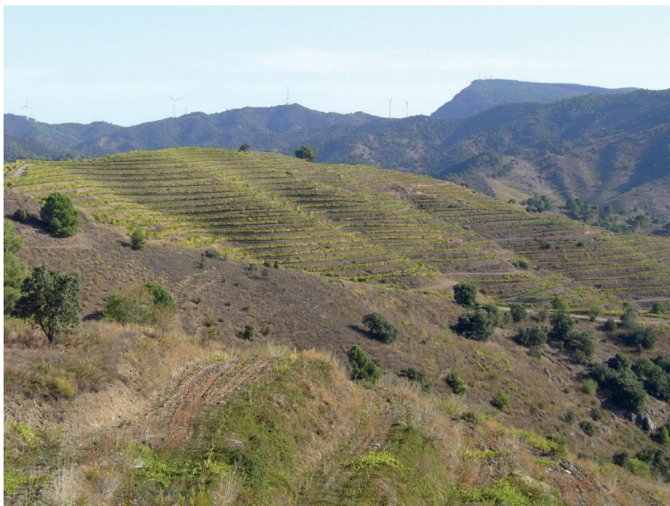
FIGURA 1. Paisatge prioratí vitícola. Vinyes en costers